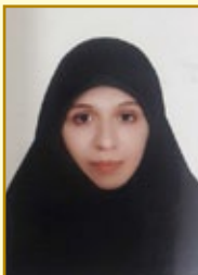
راه یافته به مرحله کشوری؛ رتبه ۲